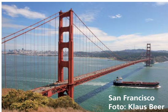
San Francisco

23-tägige Fotoreise mit drei erfahrenen Reiseführern ab Mitte September 2010. Wir fahren mit Jeeps auch Offroad-Trails und werden jeden Tag von Sonnenaufgang bis nach Sonnenuntergang nutzen! Der Schwerpunkt liegt auf Panorama- und HDR-Fotografie. Nikon stellt auf Wunsch Leihkameras und Objektive zur Verfügung.