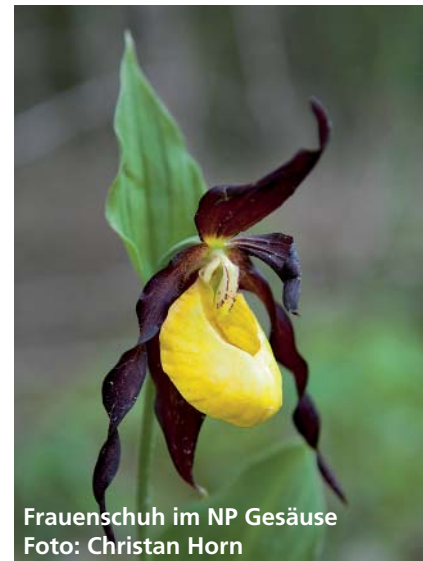
Frauenschu im NP Gesäuse

www.horncolor.de/fotoreisen E-Mail: info@horncolor.de Tel.: 089-82940214